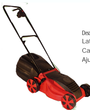
Masina de tuns iarba Motor KK 3813: 1300W

Descriere: Latimea lamei: 38cm Capacitate stocare: 35L Ajust. inaltime: 4 poziti