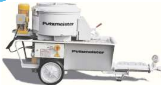
S5 EV, S5 EV/TM