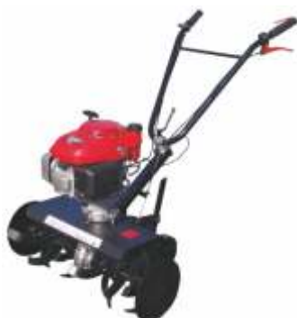
Motosapatoare Aratum 3-1-6 B55

Descriere: Tip motor disponibil Briggs & Stratton 4-4,5 HP: Latime sapare: 55-80 cm; Adancime sapare : 22cm; Greutate: 41Kg.