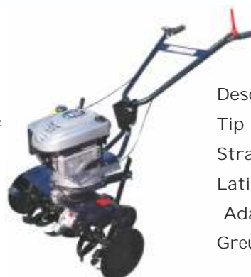
Motosapatoare Aratum 3-1-6 H55

Descriere: Tip motor disponibil Briggs Stratton 4-4,5 HP: Latime sapare: 55-80 cm; Adancime sapare : 22cm; Greutate: 43kg.