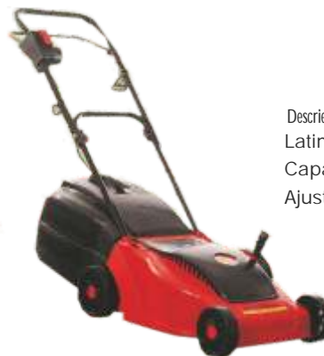
Masina de tuns iarba KK 4015 Motor: 1500W

Descriere: Latimea lamei: 40cm Capacitate stocare: 40L Ajust. inaltime: 5 poziti