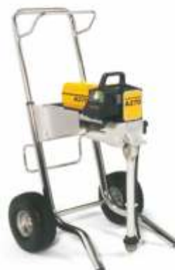
Pompa electrica aerless A 270