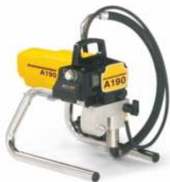
Pompa electrica aerless A 190