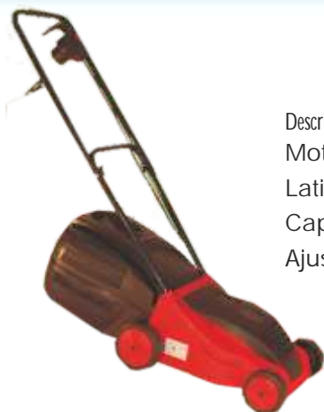
Masina de tuns iarba FM 33

Descriere: Motor: 1000W Latimea lamei: 33cm Capacitate stocare: 28L Ajust. inaltime: 3 poziti