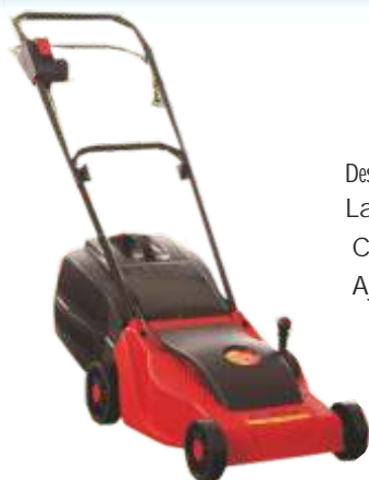
Masina de tuns iarba KK 3512 Motor: 1200W

Descriere: Latimea lamei: 35cm Capacitate stocare: 30L Ajust. inaltime: 4 poziti