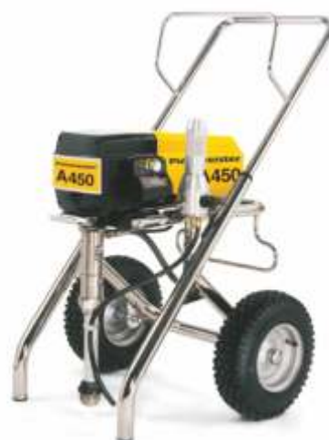
Pompa electrica aerless A 450