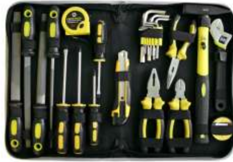
Trus de scule 25 piese hus vinilic :