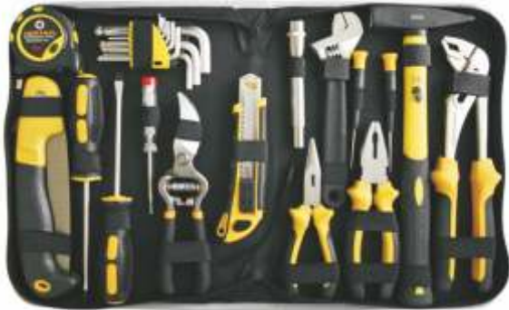
Trus de scule 24 piese hus vinilic :