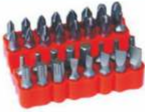
Set bituri 33 buc